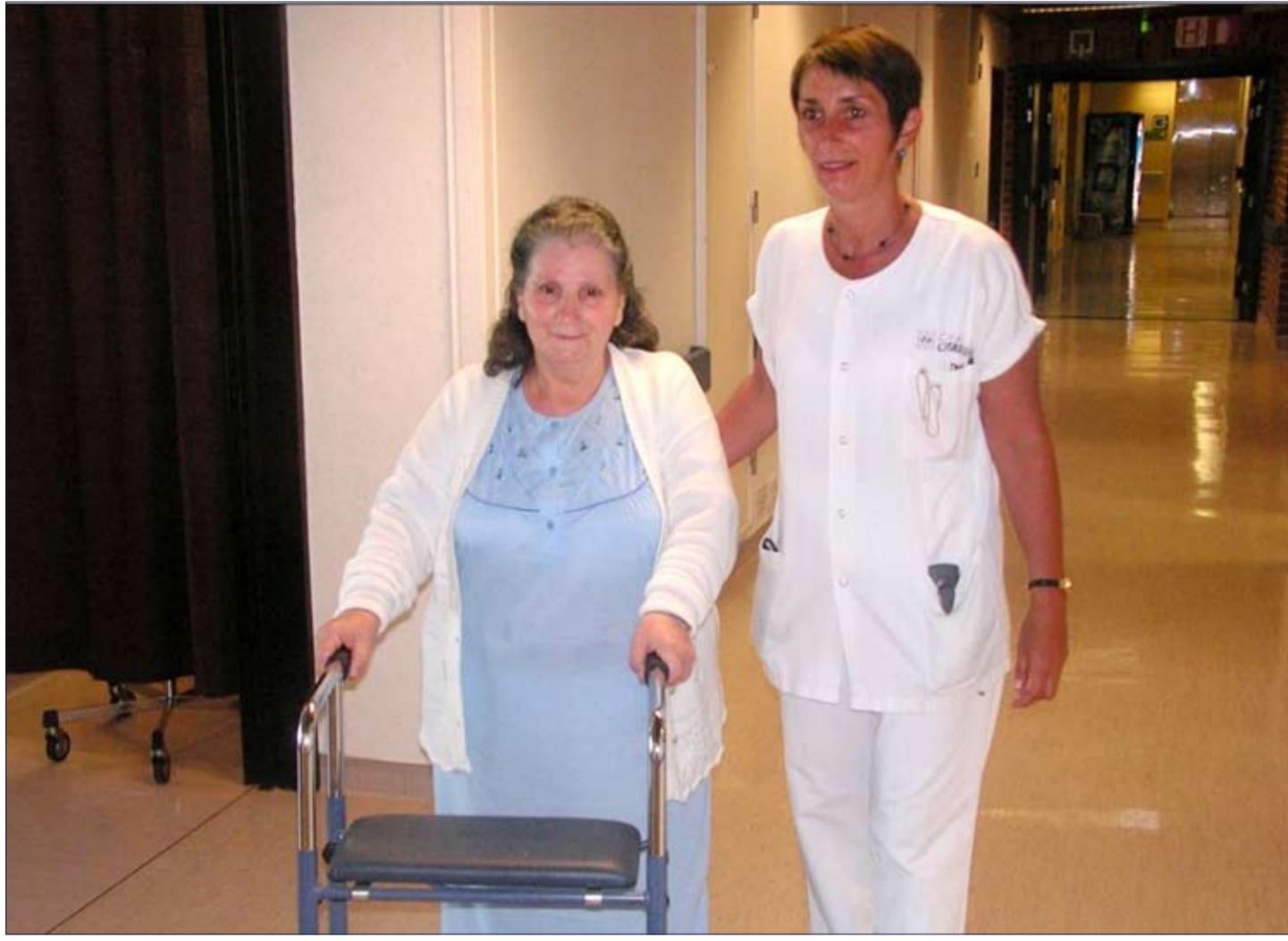
Mobilisation - Marche

En hospitalisation, le patient reçoit les informations nécessaires à son autonomie